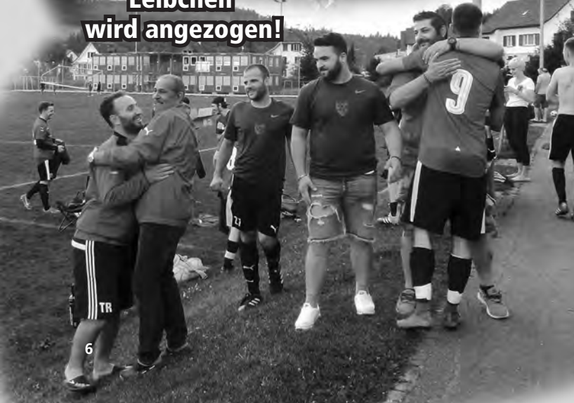
Das Aufsteiger Leibchen wird angezogen!