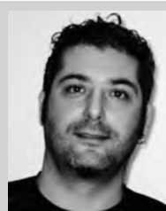
Sportlichen Grüsse Präsidium FC Seon