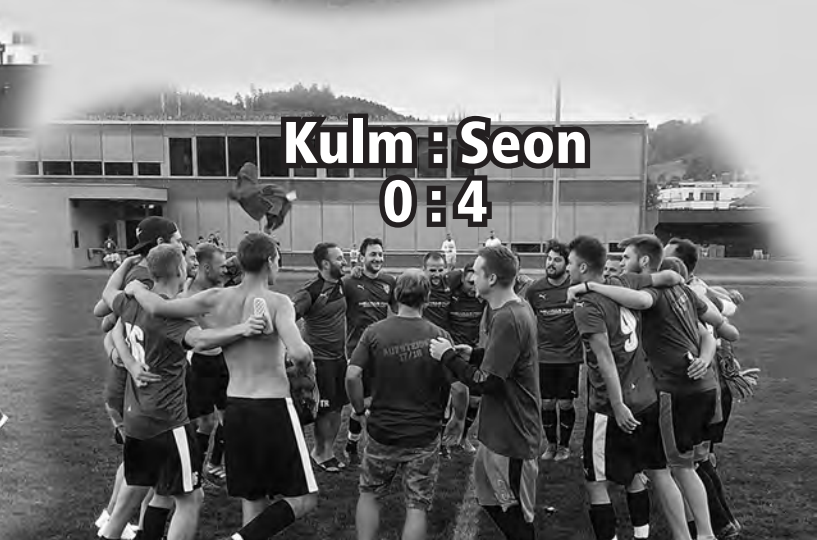
Kulm : Seon 0 : 4