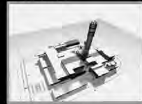
Neubau Ofenlinie KVA 2010