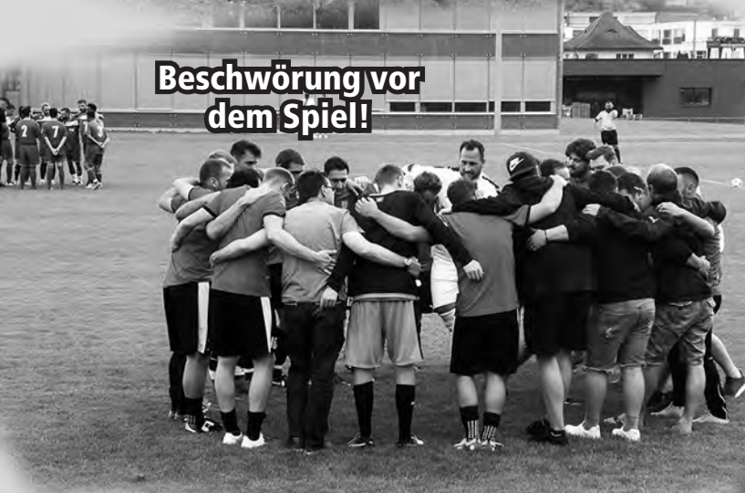
Beschwörung vor dem Spiel!