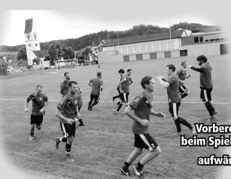
Vorbereitung beim Spiel in Kulm. aufwärmen!